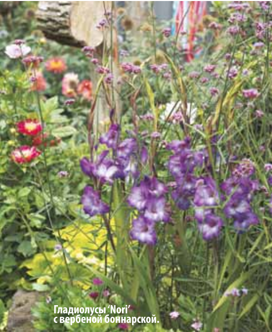
Гладиолусы 'Nogi' с вербеной боннарской.

4 Удачный подбор цветов особенно важен для срезки. Это одна из основных задач на выставках гладиолусов, где каждый цветок должен предстать не только в полном великолепии, но и продемонстрировать удачные сочетания с другими цветами. Иногда на подбор таких сочетаний уходит несколько часов.